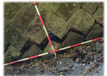
洪水吐（放水路）の損傷