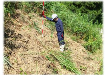
堤体の陥没（猪による被害）